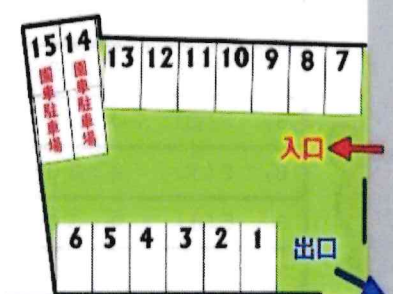
「松青こども園駐車場」詳細図

◎年齢別活動・育児講座などをキャンセルされる場合、当日までに電話でご連絡ください。少しでも早くキャンセル待ちの方に連絡をさしあげられたらと思います。よろしくお願い致します。